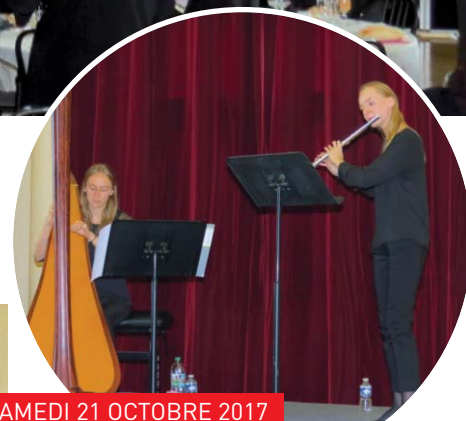
SAMEDI 21 OCTOBRE 2017