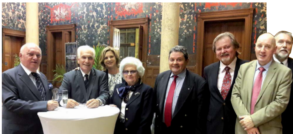
CONFÉRENCE FRANCO-AUTRICHIENNE DU VENDREDI 13 OCTOBRE 2017